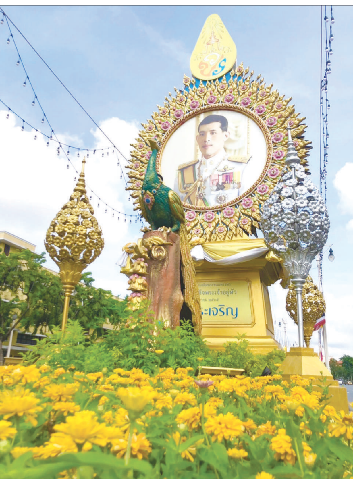
กรุงเทพมหานครจัดซุ้มเฉลิมพระเกียรติ เนื่องในโอกาสวันเฉลิมพระชนมพรรษาพระบาทสมเด็จพระเจ้าอยู่หัวฯ วันที่ 28 กรกฎาคม 2565 เพื่อให้ประชาชนได้ร่วมเฉลิมพระเกียรติ ตามแนวถนนราชดำเนิน ซึ่งมีการติดตั้งซุ้มเฉลิมพระเกียรติและประดับพระบรมฉายาลักษณ์ดังตามตระการตา