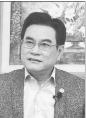
จรินทร์ ลักษณวิศิษฏ์ จะเติบโตได้สูงกว่า 3% เล็กน้อย จากการบริโภคภาคเอกชนที่เพิ่มขึ้น ขณะที่นักท่องเที่ยวต่างชาติเพิ่มขึ้นต่อเนื่องหลังผ่อนคลายมาตรการควบคุมการระบาด และมาตรการจำกัดการเดินทางระหว่างประเทศ.

กรมชยาตัว 2.0-3.0% จาก การบริโภคในประเทศส่งสัญญาณปรับตัวดีหลังการเปิดประเทศ โดยต้องจับตาดูการขึ้นดอกเบี้ย ความขัดแย้งระหว่างรัสเซียและยูเครน เศรษฐกิจโลกถดถอยและปัญหาการขาดแคลนอุปทาน รวมถึงวิกฤตเศรษฐกิจของประเทศกำลังพัฒนาหลายประเทศอาจกระทบการค้าระหว่างประเทศ และการลงทุนของไทย