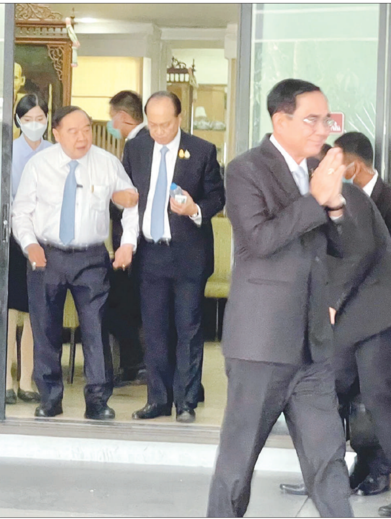
พล.อ.ประยุทธ์ จันทร์โอชา นายกรัฐมนตรีและ ร.ม.ว.กลาโหม, พล.อ.ประวิตร วงษ์สุวรรณ รองนายกรัฐมนตรี และหัวหน้าพรรคพลังประชารัฐ และ พล.อ.อนุพงษ์ เผ่าจินดา ร.ม.ว.มหาดไทย ขณะเดินออกจากห้องรับรองที่มูลนิธิปารอยต่อ 5 จังหวัด ภายหลังจากพิธีมอบรางวัล 30 นาที ในงานวันคล้ายวันเกิดครบ 77 ปี พล.อ.ประวิตร เมื่อช่วงเช้านี้ที่ 11 ส.ค.

ไทยโพสต์ • “คลัง” ดีเดย์ลงทะเลเบียนคนจนรอบใหม่ 5 ก.ย.-19 ต.ค.65 คาดเปิดให้ใช้สิทธิ์ได้ ม.ค.66 เรียกถกแบงก์รัฐสั่งผูกมัดกำลังตรึงอัตราดอกเบี้ยช่วยลูกค้า “ออมสิน” ประเดิมขึ้นอัตราดอกเบี้ยเงินฝากสูงสุด 0.30% ต่อปี “สนบ.” รับแนวโน้มดอกเบี้ยขาขึ้นต้นต้นทุนกู้เงินรัฐบาลขยับขึ้นเดิมนำบริหารจัดการความเสี่ยง โยงเป็นกู้เงินอัตราดอกเบี้ยคงที่