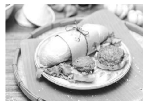
บั้นหมี่ทอดมันปลา น้ำพริกมันปู แซนดิชแบบเวียดนามที่ใส่รสชาติความเป็นไทยด้วยน้ำพริกมันปูหวานมัน