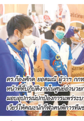
ดร.ก้องศักดิ์ ยอดมณี ผู้ว่า กกท.เข้าเยี่ยมให้กำลังใจคณะเจ้าหน้าที่ที่ปฏิบัติงานในศูนย์อำนวยความสะดวกแก่นักกีฬาไทย พร้อมทั้งได้มอบอุปกรณ์ป้องกันการแพร่ระบาดของโควิด-19 และยาฟ้าฟิวราเรียรี่ให้กับคณะนักกีฬาคนพิการทีมชาติไทย