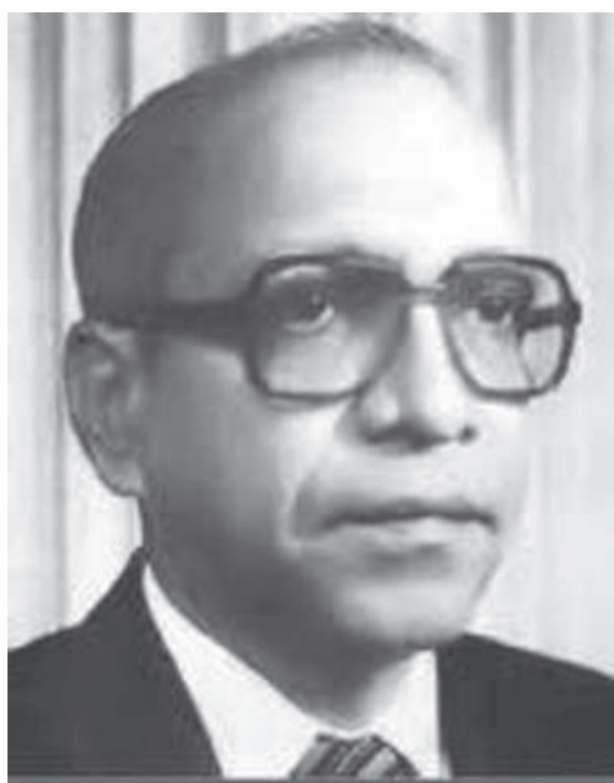
เทวัน นายร์ (Devan Nair) ประธานาธิบดีสิงคโปร์ในอดีต

ก็ยังดูคล้ายระบอบการปกครองของอังกฤษก่อน ค.ศ.1688 ที่พระมหากษัตริย์ดำรงกับฝ่ายรัฐสภา และในที่สุดดัตช์ก็กลับมากปกครองโดยสถาบันพระมหากษัตริย์อีก และในปี ค.ศ.1814 ดัตช์ได้เข้าสู่ระบอบพระมหากษัตริย์ภายใต้รัฐธรรมนูญเป็นครั้งแรกและดำรงอยู่เรื่อยมาจนถึงปัจจุบัน ซึ่งการเปลี่ยนแปลงการปกครองเป็นระบอบพระมหากษัตริย์ภายใต้รัฐธรรมนูญของดัตช์นั้นเกิดขึ้นในช่วงเดียวกับนอร์เวย์ และหลังจากสวีเดนเพียง 5 ปี และก่อนเดนมาร์ก 35 ปี และก่อนไทย 118 ปี