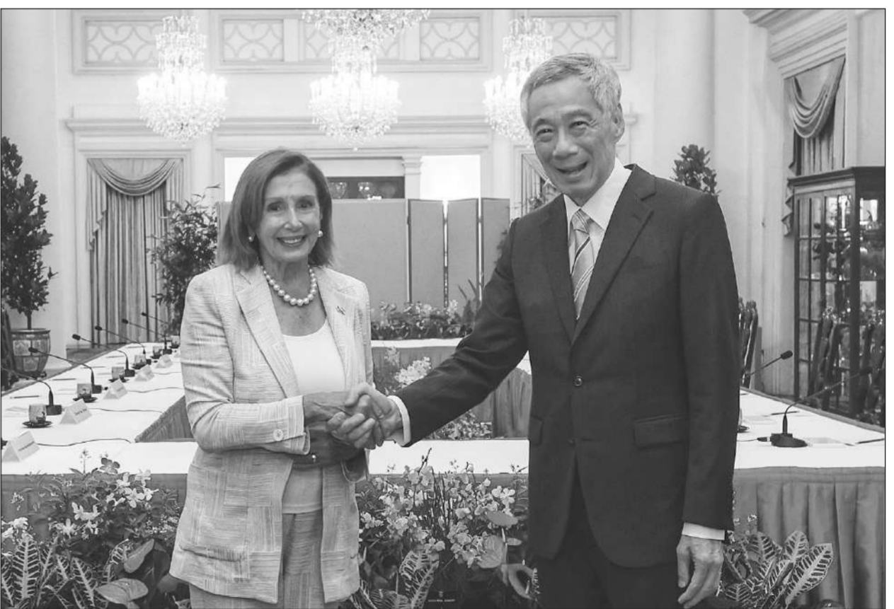
แนนซีเพโลซี • นายกรัฐมนตรี ลี เซียน ลุง ของสิงคโปร์ จับมือกับแนนซี เพโลซี ประธานสภาผู้แทนราษฎรสหรัฐฯ ระหว่างหารือกันที่ท่าเทียบประธานาธิบดีสิงคโปร์ เมื่อวันที่ 1 สิงหาคม

รายงานเรื่องแผนจะเยือนไต้หวันของประธานสภาผู้แทนราษฎรสหรัฐฯ ทำให้จีนเดือดดาล แม้ประธานาธิบดี โจ ไบเดน เองก็พยายามลดอุณหภูมิความตึงเครียดระหว่างสหรัฐฯ กับจีน