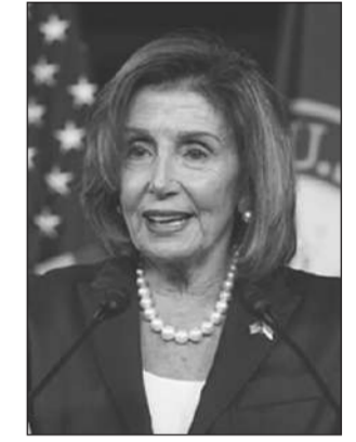
แนนซี เพโลซี

"เพโลซี" นั้นชื่อเต็มๆ ว่า "แนนซี เพอร์ซี่ ดิอาเลซาน โคร เพโลซี" เกิดเมื่อวันที่ 26 มีนาคม 2483 ที่เมืองบัลติมอร์ รัฐแมริแลนด์ โดยปัจจุบันครองตำแหน่งประธานสภาผู้แทนราษฎรเป็นสมัยที่ 4 แล้ว โดยเมื่อครั้งที่เธอครองเก้าอี้ครั้งแรกก็สร้างประวัติศาสตร์ในการเป็นประธานสภาผู้แทนราษฎรคนแรกที่เป็นสตรี รวมทั้งเป็นชาวแคลิฟอร์เนียคนแรกและชาวอิตาเลียน-อเมริกันคนแรกที่ได้รับตำแหน่ง และยังเป็นผู้หญิงที่มีตำแหน่งสูงสุดในประวัติศาสตร์การปกครองของสหรัฐอเมริกา รวมถึงเป็นสภาผู้สตรีคนแรกในประวัติศาสตร์การเมืองสหรัฐฯ ที่สามารถกลับมาเป็นประธานสภาผู้แทนราษฎรอีกครั้งได้ ที่สำคัญแม้เธอจะเข้าสู่วัยคุณย่าคุณยายแล้ว แต่ความแสวงหาการเมืองของเธอก็ไม่ขาดสาย ไม่เชื่อลองไปถาม "โดนัลด์ ทรัมป์" อดีตประธานาธิบดีสหรัฐฯ ที่ถูกเธอของออกนอกในช่วงการดำรงตำแหน่งถึง 2 ครั้ง 2 คราได้ดู.