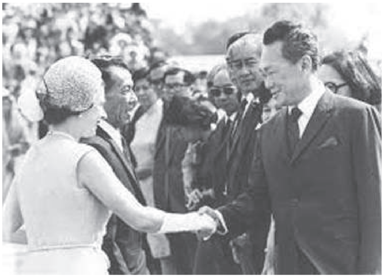
สมเด็จพระราชินีเอลิซาเบธที่สองและนายลี กวนยู

ดังนั้น ถึงแม้ว่าสาธารณรัฐดัตช์จะยังไม่เป็นสาธารณรัฐเต็มตัว เพราะดันกลับไม่มีการสืบทอดตำแหน่งทางสายโลหิต แต่ปัญหาการดำรงกันระหว่างตำแหน่งผู้ปกครองกับฝ่ายสภา