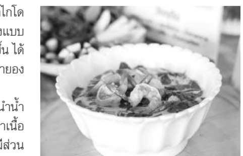
ใบเหลียงต้มกะทิกุ้งสด ทานคู่กับน้ำพริกปลาดิ่งฉ่าง ปลาพื้นถิ่นของชุมชนบางเทา