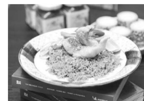
ข้าวผัดน้ำพริกมะม่วงแบบลาตทอคอสสมชา ซูรสชาติน้ำพริกมะม่วงเบาจัดจาน