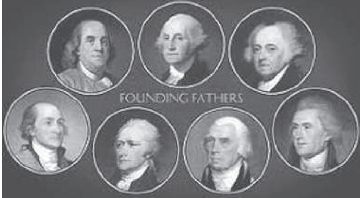
คณะบิดาผู้สร้างชาติอเมริกัน (the American Founding Fathers)

แต่พอนายลีจะวางมือจากการเมือง ในปี พ.ศ.2536 เขากลับเสนอแก่รัฐธรรมนูญเพิ่มอำนาจประธานาธิบดีมากขึ้น โดยเขาให้เหตุผลว่า ก่อนหน้านี้ประธานาธิบดีไม่จำเป็นต้องมีอำนาจมาก เพราะตัวนายลีในฐานะนายกรัฐมนตรีเป็นคนที่ถูกทิศตัวเพื่อสิงคโปร์ ไม่โกงไม่กิน (พูดง่าย ๆ ก็คือเป็นคนเก่ง คนดี นั่นแหละ) แต่เขาไม่แน่ใจว่า คนที่จะมาเป็นนายกรัฐมนตรีต่อจากเขาจะดีและเก่งเหมือนเขาไหม ดังนั้น จึงจำเป็นต้องให้อำนาจประธานาธิบดีมากขึ้นเพื่อตรวจสอบถ่วงดุลการใช้อำนาจของนายกรัฐมนตรี และอีกทางหนึ่งในการทำให้สถาบันประธานาธิบดีมีอำนาจมากขึ้นก็ให้ประธานาธิบดีมาจากการเลือกตั้ง โดยก่อนหน้านั้นมาจากการเลือกโดยรัฐสภาสิงคโปร์ อันหมายความว่า เสียข้างมากในสภา (ซึ่งเป็นของนายลี) เป็นเสียงที่กำหนดตัวคนเป็นประธานาธิบดี ซึ่งก็คือ เลือกคนที่ว่านอนสอนง่ายไม่ขัดนายลีนั่นเอง เออเน! ตีที่นายลีพัฒนาสิงคโปร์ได้อย่างสุดยอด แต่ให้สุดท้ายคนแค่นี้ ลองมาทำแบบนี้ในเมืองไทย ดูสิว่าจะเกิดอะไรขึ้น?!