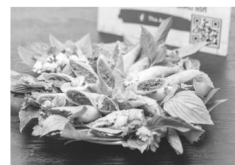
เปาะเปี๊ยะน้ำพริก แผ่นแป้งกรอบห่อด้วยน้ำปลาร้าคั่วเพิ่มความหวานด้วยกุนเชียง เป็นเมนูหวานที่เข้าท่า