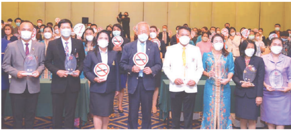
สำหรับโรงเรียนต้นแบบปลอดบุหรี่และเครือข่ายผู้ปกครอง 10 แห่งสังกัดกรุงเทพมหานคร

เครือข่ายครูเพื่อโรงเรียนปลอดบุหรี่ มูลนิธิรณรงค์เพื่อการไม่สูบบุหรี่ โดยการสนับสนุนของสำนักงานกองทุนสนับสนุนการส่งเสริมสุขภาพ (สสส) จัดงานเวทีเชิดชูเกียรติ 10 โรงเรียนต้นแบบปลอดบุหรี่และแอลกอฮอล์ พื้นที่กรุงเทพฯ ณ ห้องราชเทวี 2 โรงแรมเอเชีย เมื่อเร็วๆ นี้ โดยมีสาระที่น่าสนใจ และสมควรแก่การปรบมือ เพราะหลังจากขับเคลื่อนงานโรงเรียนปลอดบุหรี่ต่อเนื่องตั้งแต่ปี 2548 นั้น ตัวเลขของเด็กและเยาวชน ตลอดจนผู้ปกครอง ที่ตระหนักถึงโทษภัยของบุหรี่และแอลกอฮอล์นั้น มีนัยสำคัญลดลงตามเป้าประสงค์ นอกจากนี้ยังมีมีการส่งต่อ "โมเดล" โรงเรียนปลอดบุหรี่ด้วยการเผยแพร่แนวทางต่างๆ อย่างกว้างขวาง