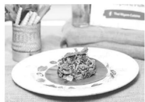
พลาเนื้อน่องลายน้ำพริกโปนา

ซึ่งในแต่ละภาคก็จะมีน้ำพริกที่เป็นเอกลักษณ์ประจำถิ่นของตัวเอง อย่างภาคกลาง มีน้ำพริกแกงเผ็ด น้ำพริกแกงหมู น้ำพริกปลาทู น้ำพริกไข่เค็ม น้ำพริกตาแดง และน้ำพริกแกงดา ภาคใต้ซึ่งเรียกน้ำพริกว่า น้ำซุบ มีน้ำพริกซุบไข่ปูย่าง น้ำพริกแกงเผ็ด น้ำพริกอกาณาสี ภาคเหนือ มีน้ำพริกหนม น้ำพริกปลา น้ำพริกอ่อง น้ำพริกควัทราย ภาคอีสานที่มีชื่อเรียกน้ำพริกหลายแบบ อาทิ ปัน แจ่ว ซุบ เช่น แจ่วบอง น้ำพริกปลาร้าคั่ว และอีกมากมาย และเพื่อให้คนรุ่นใหม่ที่มีนิยมนบริโภคอาหารหลากหลายได้ลิ้มรสหลากหลายสัญชาติ ได้รู้จักและยอมรับน้ำพริกไทยดีขึ้น กรมส่งเสริมวัฒนธรรม (สวธ.) จึงได้จัดทำโครงการ The journey of น้ำพริกจากบ้านนาสู่มหานคร คัดเลือก 20 น้ำพริกสูตรเด็ดของชุมชนทั่วทุกภาคของประเทศไทย ที่มาในรูปแบบใหม่ภายใต้การรังสรรค์ของ 20 เชฟจากร้านดังในกรุงเทพฯ จนกลายเป็นน้ำพริกเมนูพิเศษ สู่ความเป็นอาหารไทยฟิวชั่นในสไตล์ญี่ปุ่น เวียดนาม อิตาลี ซึ่งจะเป็นแรงบันดาลใจในการนำน้ำพริกไปแปรรูปเป็นอาหารได้หลากหลายเมนูในวันต่อไป